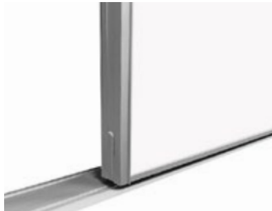
Nano 11 mm