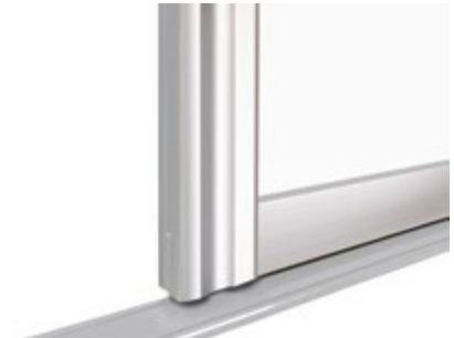
Aalto 50 mm