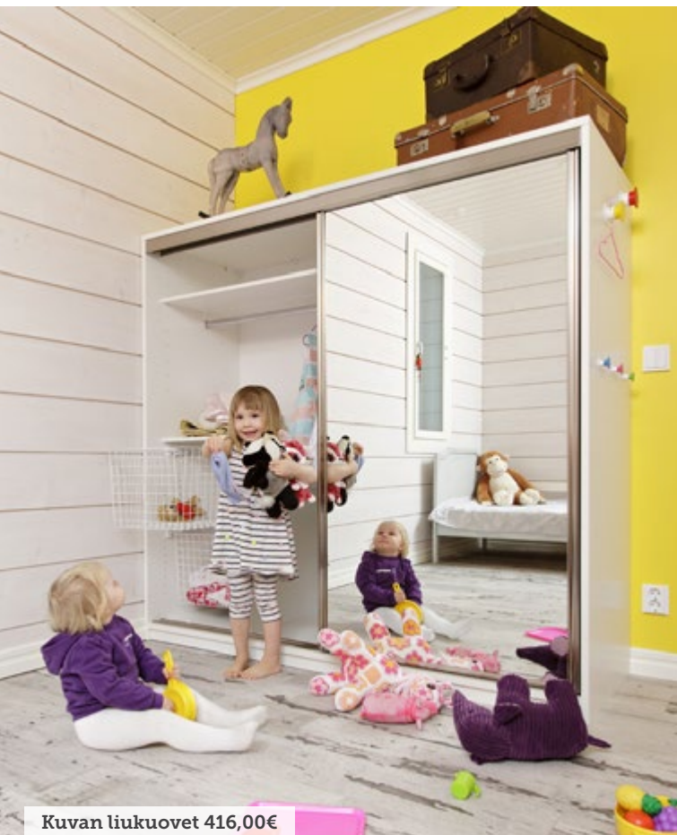
Kuvan liukuovet 416,00€

Mirror Linen liukuovien asennus on helppoa ja yksinkertaista: kiinnitä yläkisko, kiinnitä alakisko, nosta ovet paikoilleen ja säädä pyörästä kohdilleen. Verkkosivuiltamme www.mirrorline.fi löydät asennusvideoita, joita seuraamalla asennusvaiheet sujuvat kuin tanssi.