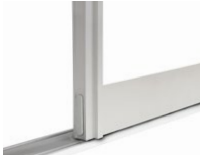
Twin 9 23 mm