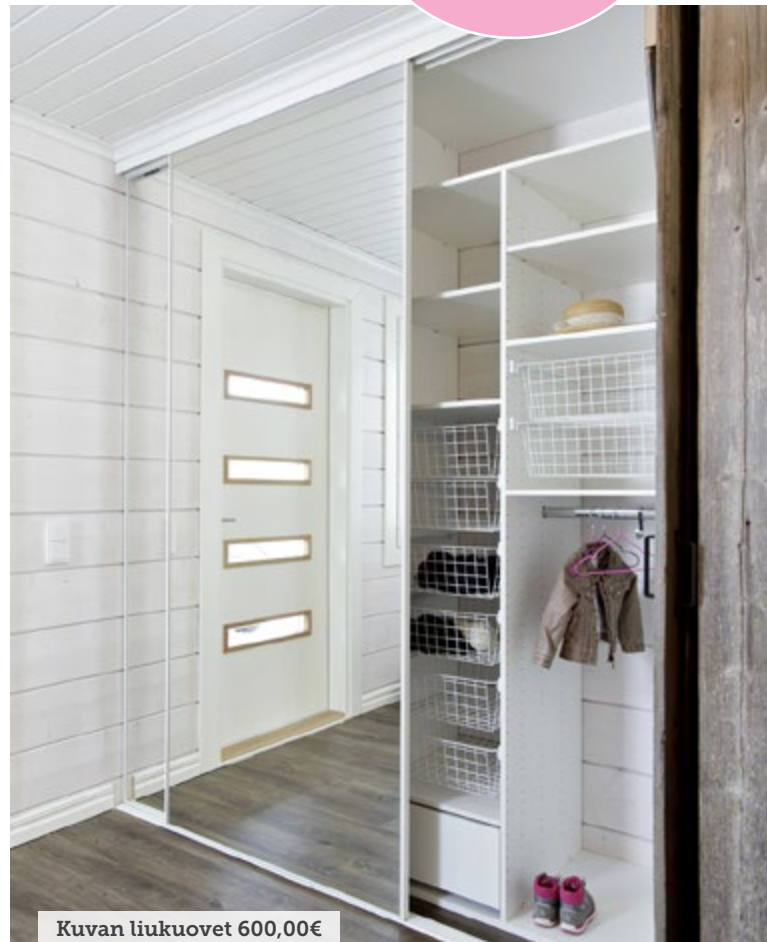
Kuvan liukuovet 600,00€

Ei yllätyskuluja! Saat meiltä pitävän hinnan toimituksille – sisältäen kaiken tarvikkeista asennukseen.