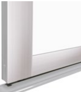
Classic Maksi 70 mm