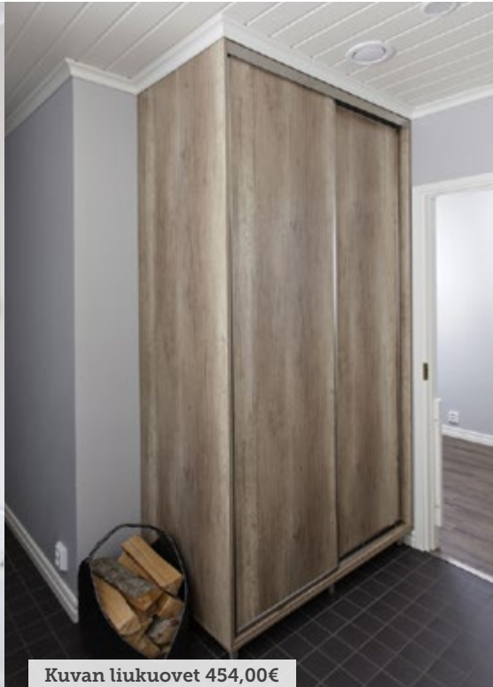
Kuvan liukuovet 454,00€