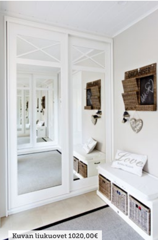
Kuvan liukuovet 1020,00€