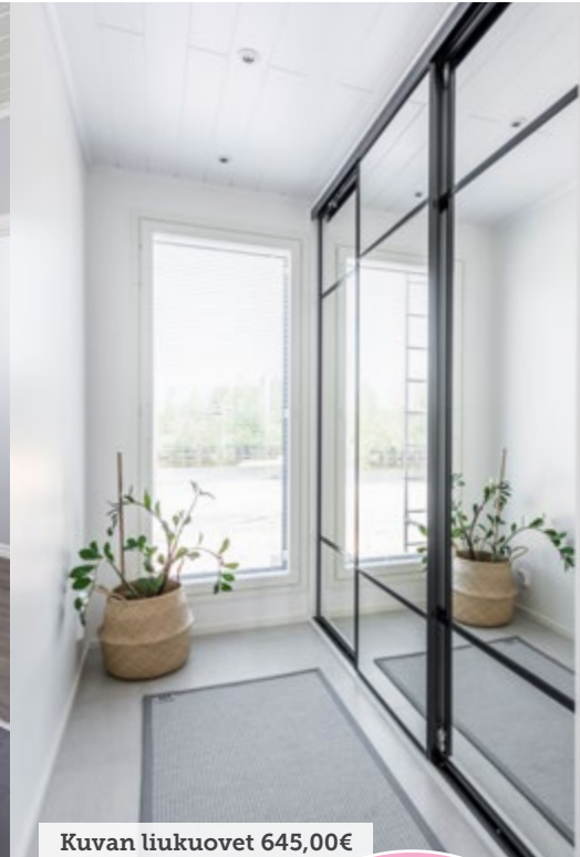
Kuvan liukuovet 645,00€