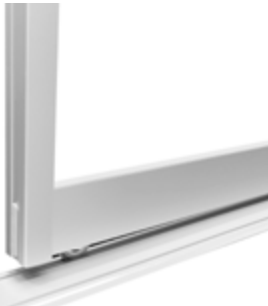
Classic Mini 28 mm