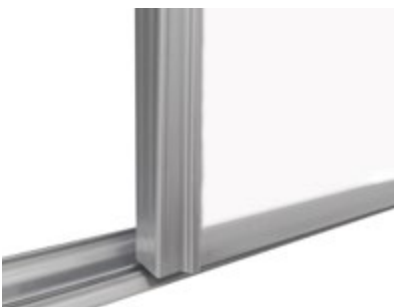
Kapea 22 mm